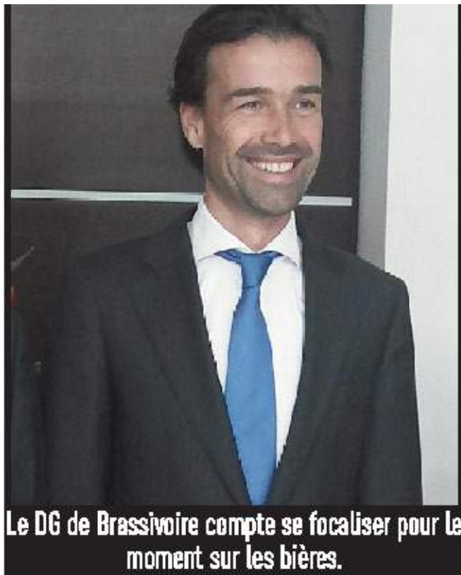
Le DG de Brassivoire compte se focaliser pour le moment sur les bières.

compte atteindre la barre de 600 à 700 emplois directs, 40 000 emplois indirects et une production de 160 000 hectolitres. Le